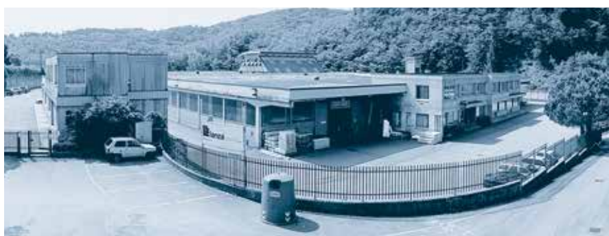
Gapi S.p.A. (LANZA) Gandosso (BG) - Italia

Development and production of compounds for all Companies of the Group