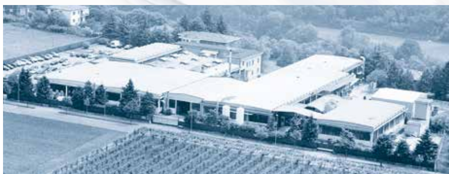
Gapi S.p.A. Castelli Calepio (BG) - Italia

Produzione O-RINGS e particolari in gomma