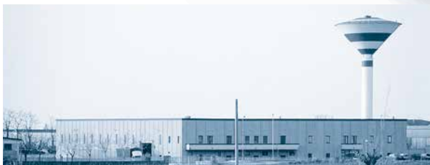
Gapi S.p.A. Castelli Calepio (BG) - Italia