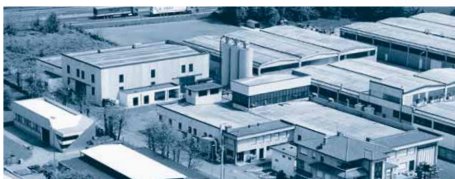
Gapi S.p.A. Compounds Grumello d.m. (BG) - Italia

Sviluppo e fabbricazione di tutte le mescole per le aziende del gruppo