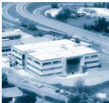
Gapi S.p.A. Castelli Calepio (BG) - Italia