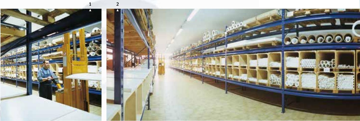
1/2 Magazzino semilavorati PTFE. 3 Confezionamento prodotti in spedizione.

Products must be where the Customer needs it, and at the right time. Technical characteristics alone are not enough. This is "JUST IN TIME".